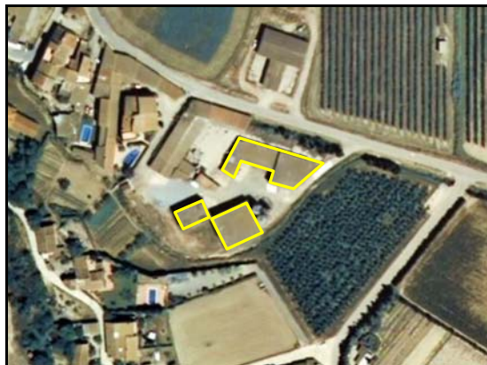
Edificación ligera – TIPO_0057: “/nave abierta”