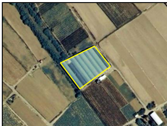
Edificación ligera – TIPO_0057: “/invernadero”