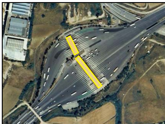
Edificación ligera – TIPO_0057: “/marquesina”